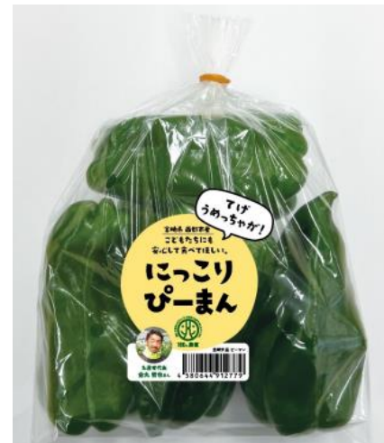
農総研のブランディング事例